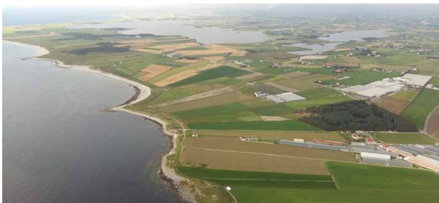
Orrestranda ut mot Nordsjøen nordvestover mot Revtangen. Orrevatnet midt i øvre del av bilde.