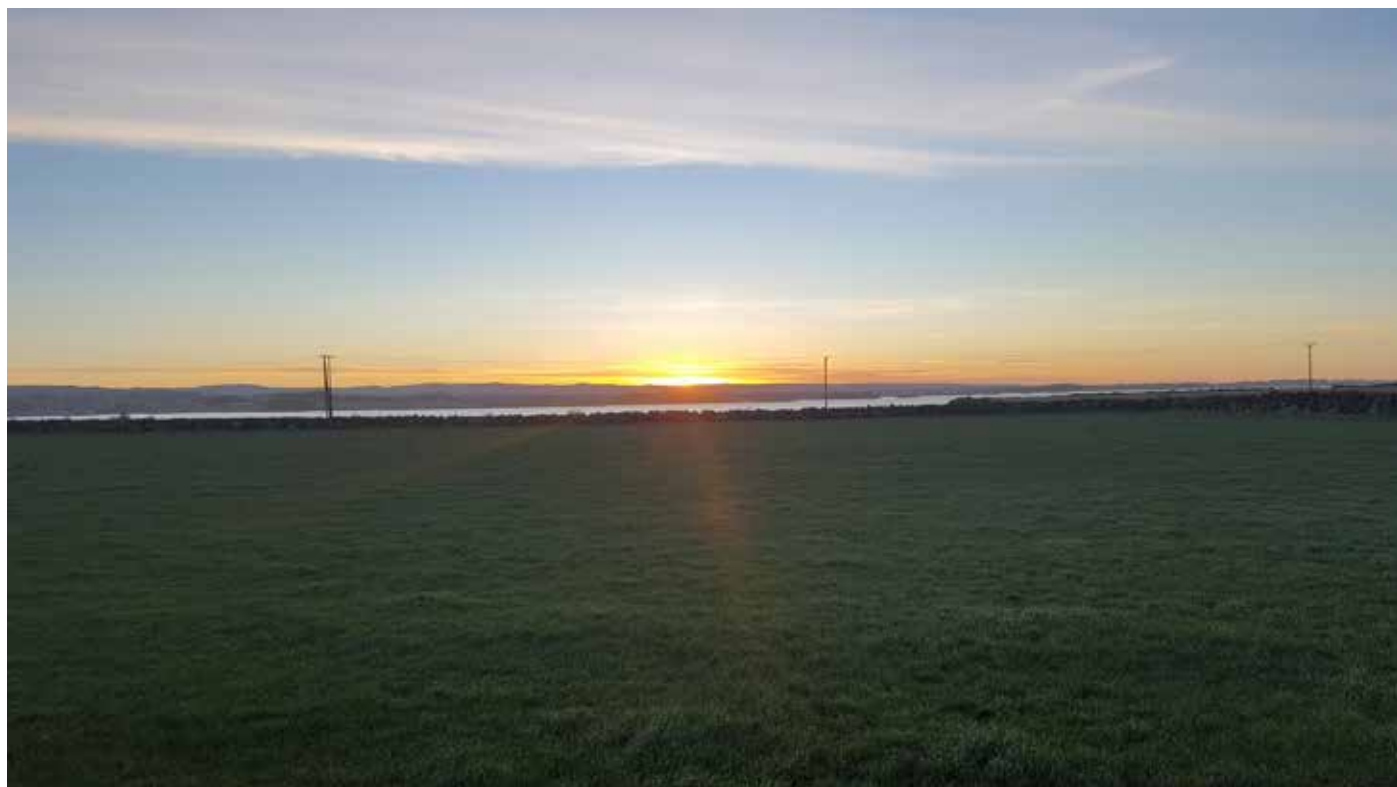
Soloppgang på Reve - Sett ifrå Reve og i renting Høgjæren vindpark (midt i bilde).

Klepp Energi AS har pr. 31.12.19 et langsiktig lån fra datterselskapet Klepp Energi Invest AS . Årlig rente på lånet er 3 mnd. NIBOR. Der NIBOR blir fastsett som gjennomsnittet av tre mnd. NIBOR for de tre siste noterings dagene i mai og november. Klepp Energi AS har pr. 31.12.19 et langsiktig lån fra Klepp Energi Invest AS på kr 7 041 (tall i 1000).